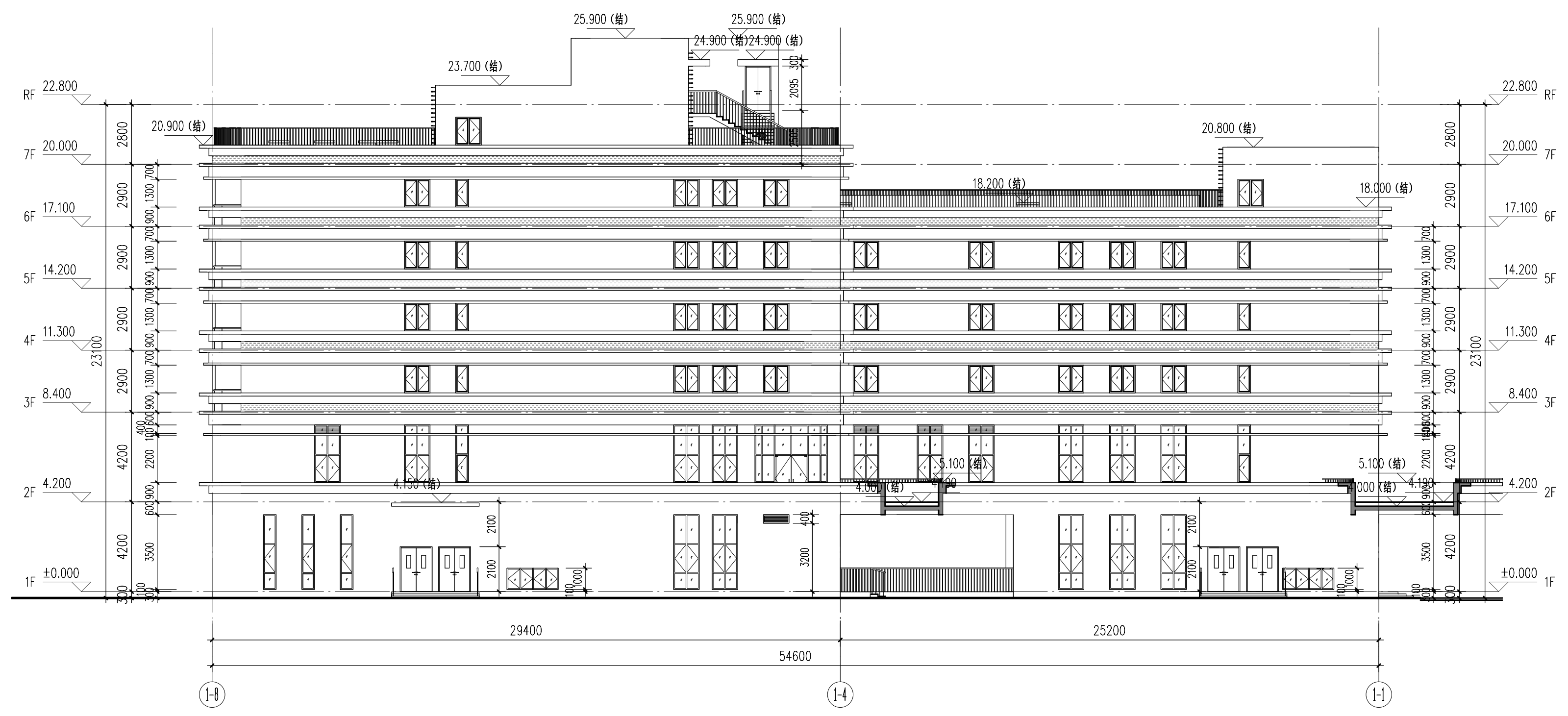
1栋轴 I-B 至轴 I-I 立面图 1 : 150