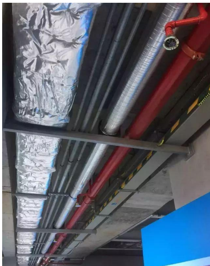
成排管线共用支吊架