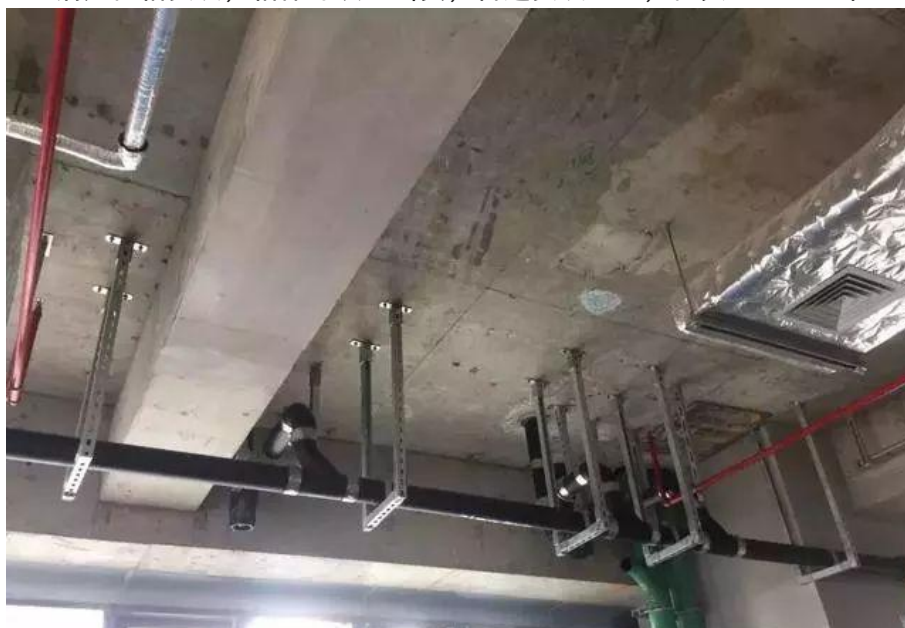
排水管道安装坡度满足要求，支吊架布置合理