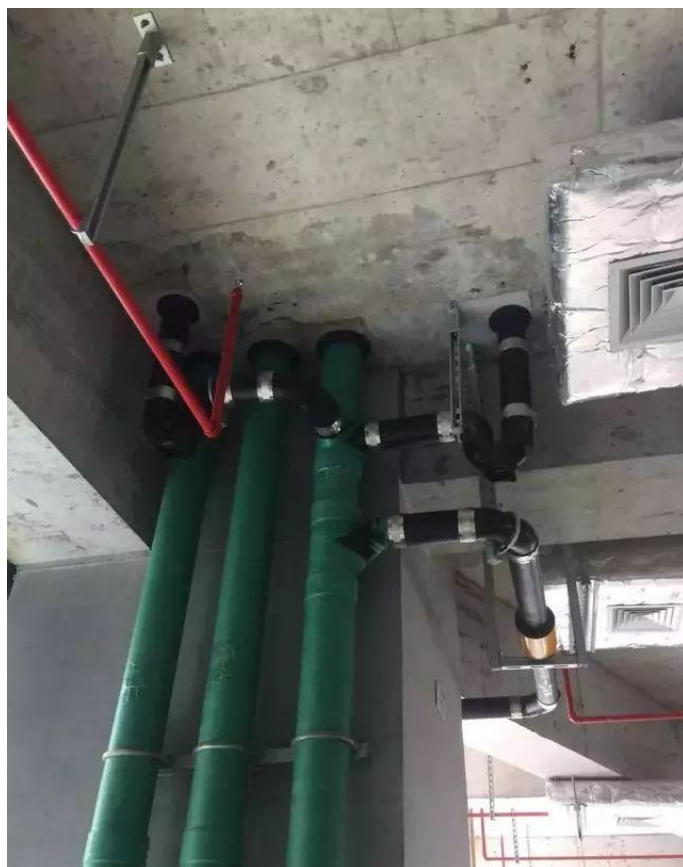
竖向排水管道，外用防护膜保护，支架结实耐用，管根设置橡胶圈，界面分明