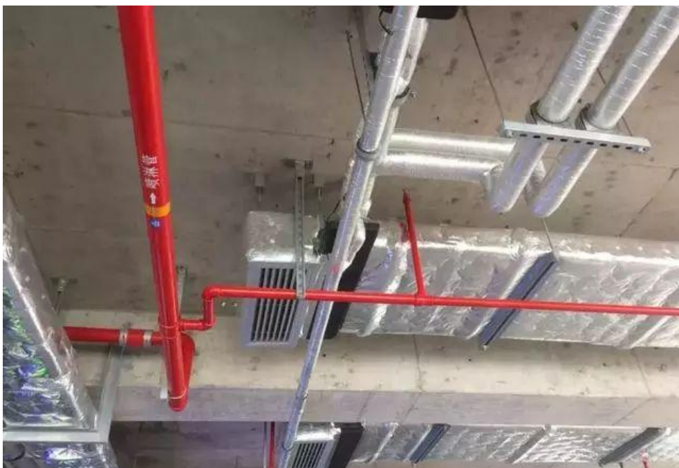
喷淋支管横平竖直，标识清楚、支架布置间距合理