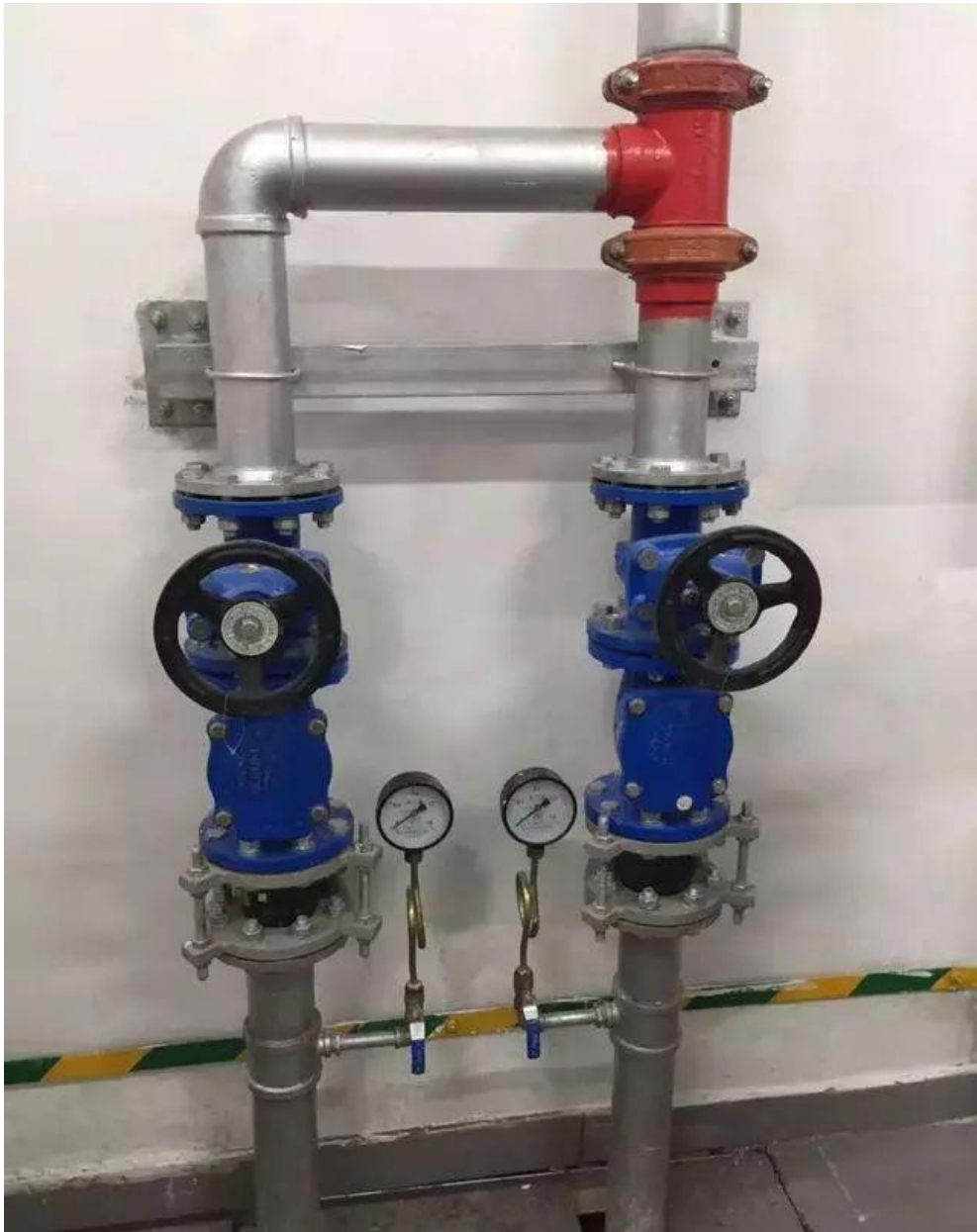
压力排水管道阀部件布置合理，支架结实耐用