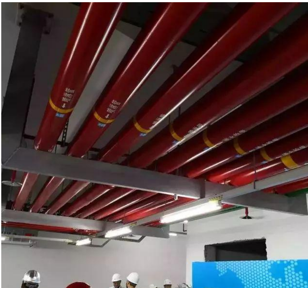
消防喷淋管道间距一致，标识清楚、成排成线