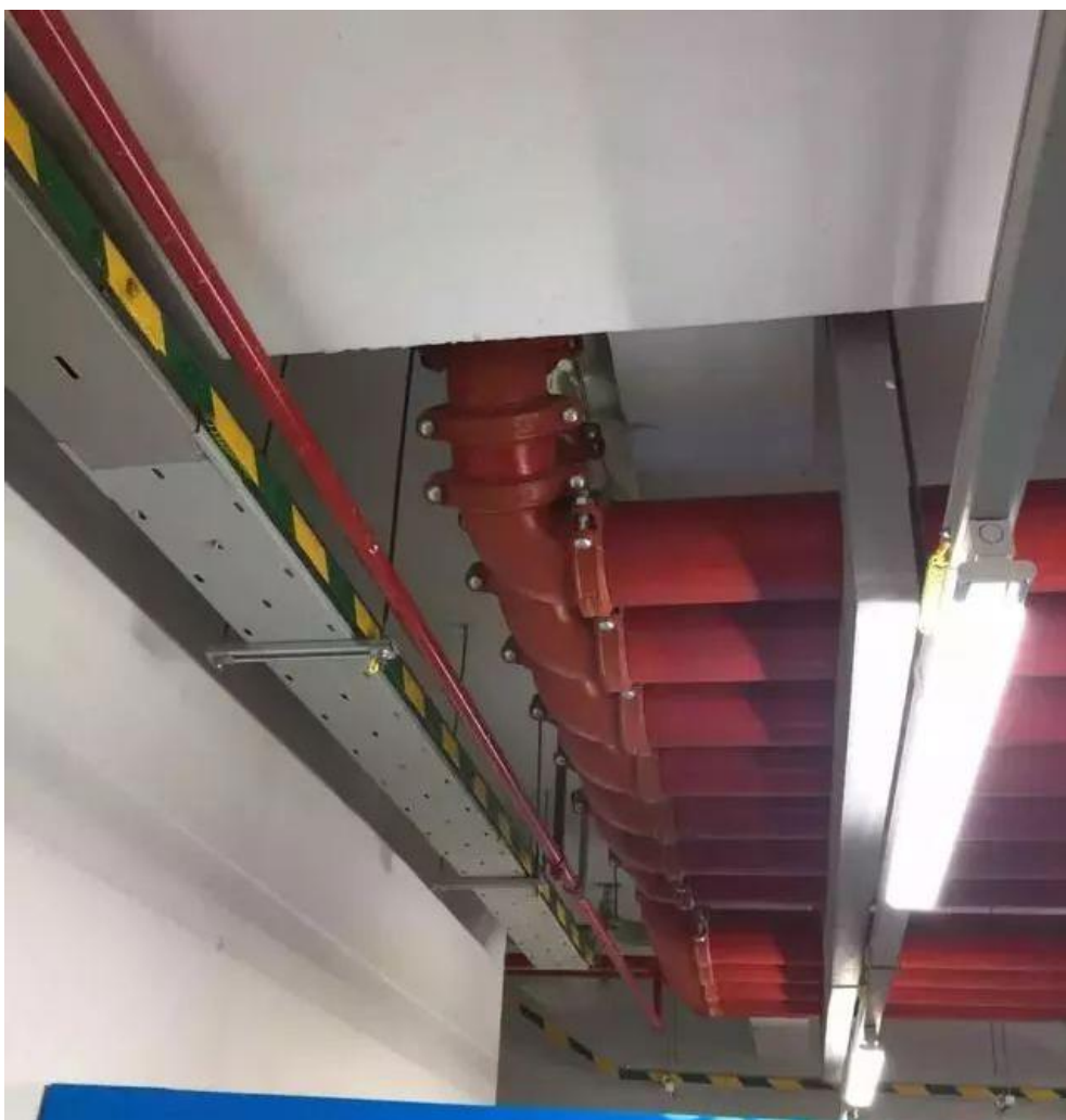
成排管道，弯头处排成一条线