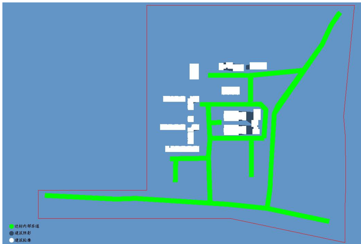
图 5.2-1 车道平面图