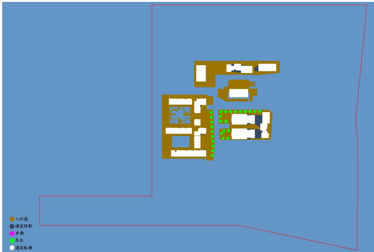
图 5.1-1 场地遮阴平面图