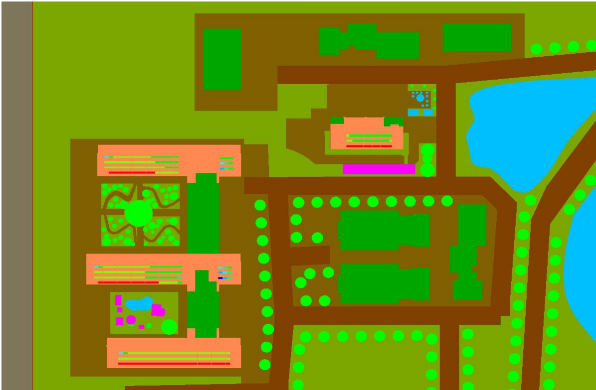
图 1.2 场地平面图